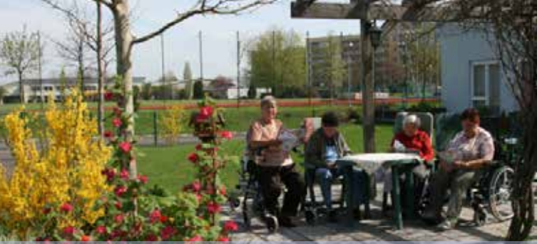
Respekt und Vertrauen - Wir pflegen mit Herz