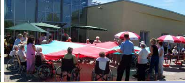
Respekt und Vertrauen - Wir pflegen mit Herz

Unsere Zimmer sind möbliert und mit modernen Pflegebetten ausgestattet. Gern können Sie ihr Zimmer mit lieb gewordenen Kleinmöbeln, Bildern und Pflanzen, ganz individuell gestalten. Zu jedem Zimmer gehört ein behindertengerecht ausgestatteter Sanitärraum mit Waschbecken, Dusche und WC. Kabelanschluss für Ihr Fernsehgerät oder /und Radio ist vorhanden, auf Wunsch ist auch ein privater Telefonanschluss möglich. Jedes Zimmer ist selbstverständlich an der Schwesternrufanlage angeschlossen.