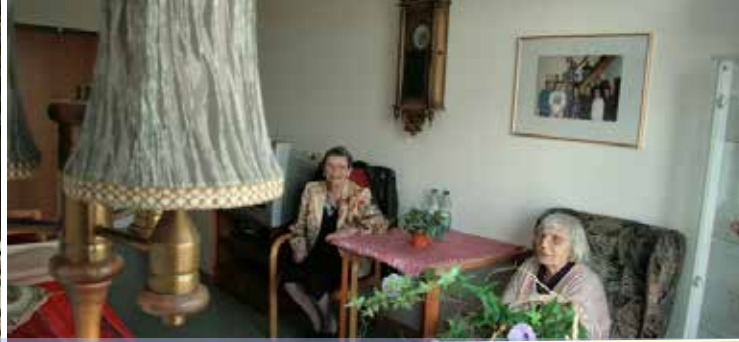
Respekt und Vertrauen - Wir pflegen mit Herz

Das Hermann Beims Haus befindet sich im Norden Magdeburgs im Stadtteil Kannenstieg. Am Rande eines Neubaugebietes ist es ruhig gelegen. Unsere Einrichtung ist modern und großzügig gestaltet. Alle Pflegeplätze sind auf drei ebenerdige Wohnbereiche verteilt.